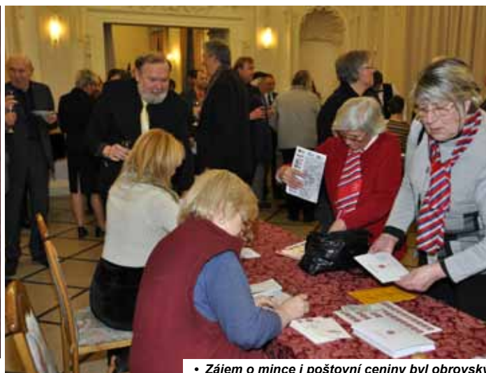
• Zájem o mince i poštovní ceniny byl obrovský