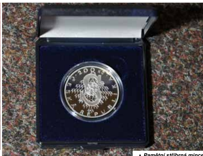
• Pamětní stříbrná mince