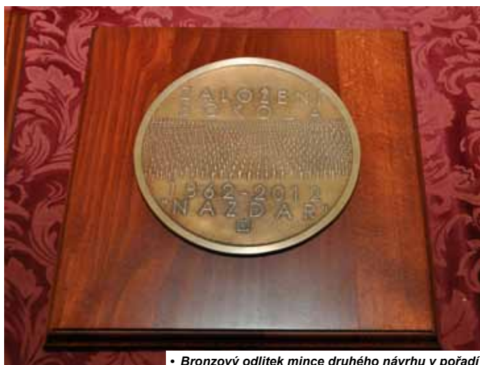
• Bronzový odlitek mince druhého návrhu v pořadí